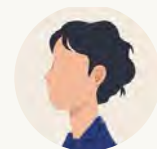
介護 | 人事担当